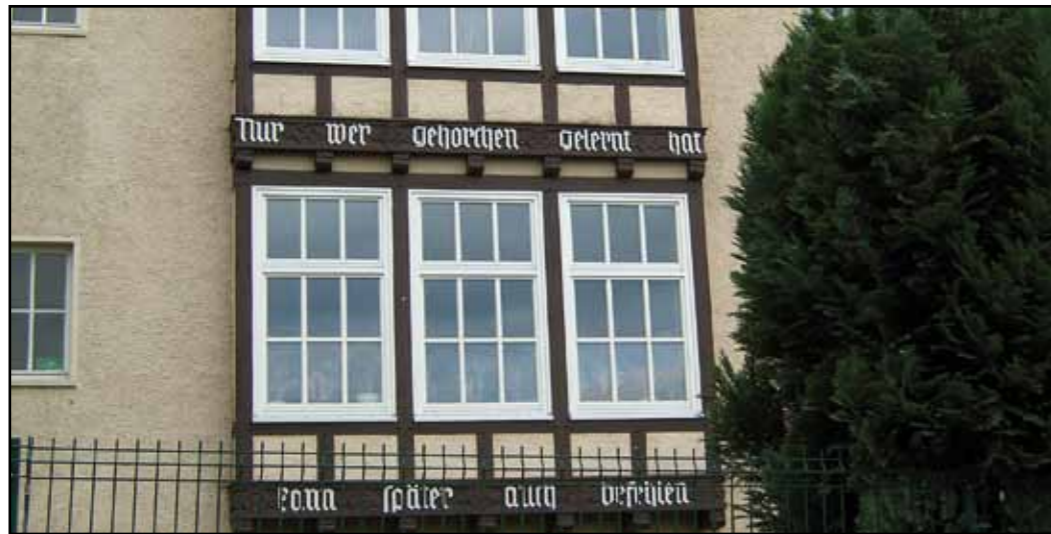
Ziesbergsschule in Salzgitter, 1939 gebaut, mit Spruch unter Denkmalschutz

metern Ausdehnung nicht »mal eben« mit dem Fahrrad zu bewältigen ist und der Busverkehr kaum vergleichbar ist mit dem einer Großstadt.