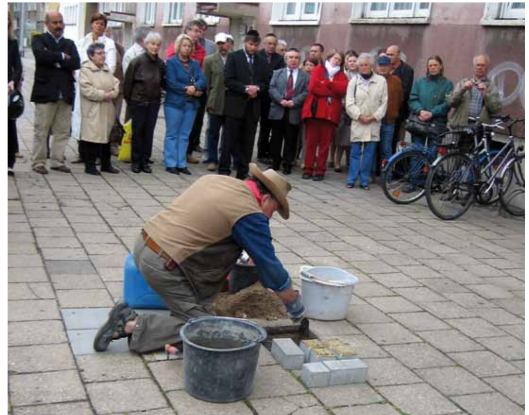
Gunter Demnig bei der ersten Stolpersteinverlegung in Dessau, Mai 2008

Auf Grundlage von persönlichen Schicksalen werben wir weitere Paten für die Verlegung von Stolpersteinen. Es folgt 2008 eine Recherche mit Beteiligung von Jugendli-