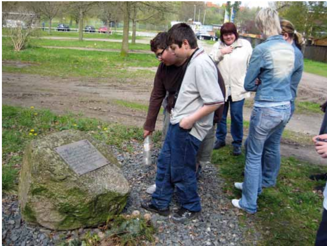
Am Gedenkstein in Salzgitter-Bad

Dieses Projekt wird finanziert im Rahmen des Programms »VIELFALT TUT GUT. Jugend für Vielfalt, Toleranz und Demokratie« des Bundesministeriums für Familie, Senioren, Frauen, und Jugend sowie mit Unterstützung der Freudenberg Stiftung und der Ford Foundation.