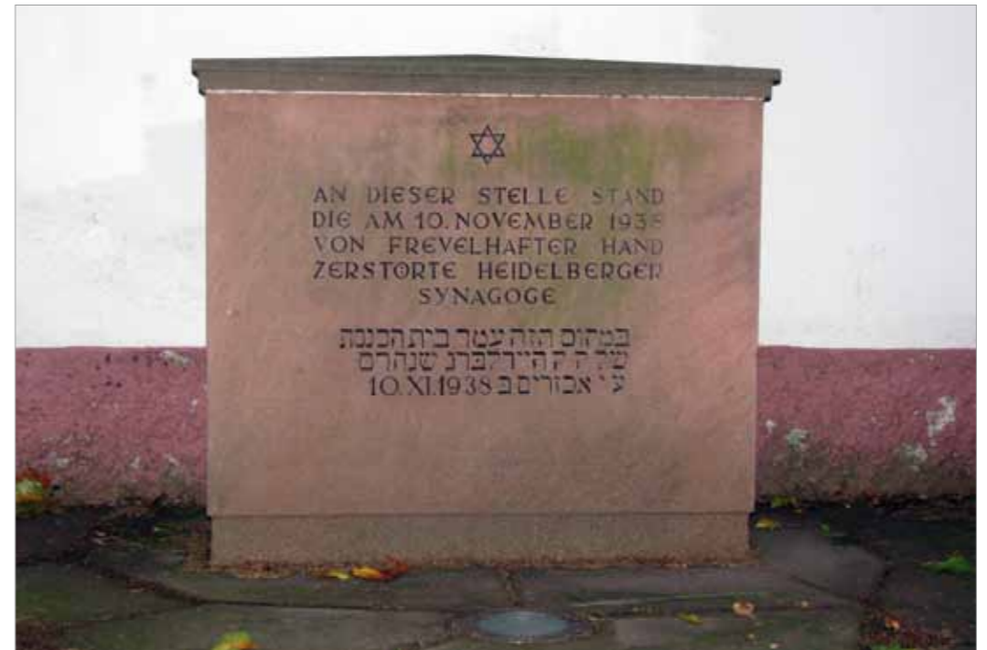
Denkstein in Heidelberg, 1948 errichtet und damals aus Angst vor Schändungen nicht am Synagogenplatz sondern im Bergfriedhof aufgestellt, erst seit 2001 am Ort der zerstörten Synagoge

Heute im vereinten Deutschland, lange nach dem Fall der Mauer, ist es Zeit, sich die Erinnerungskultur in Ost und West genauer anzuschauen. Im Austausch von Erfahrungen und Erinnerungen liegt vielleicht der Schlüssel zur souveränen Betrachtung der eigenen Geschichte. Und damit hätten die Nazis dann ihre wahre Not.