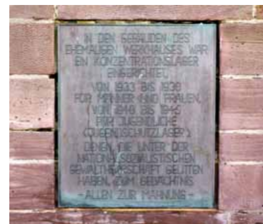
Informationstafel am ehemaligen Amtsgebäude Moringen, 1986 angebracht

info@gedenkstaette-moringen.de, www.gedenkstaette-moringen.de/