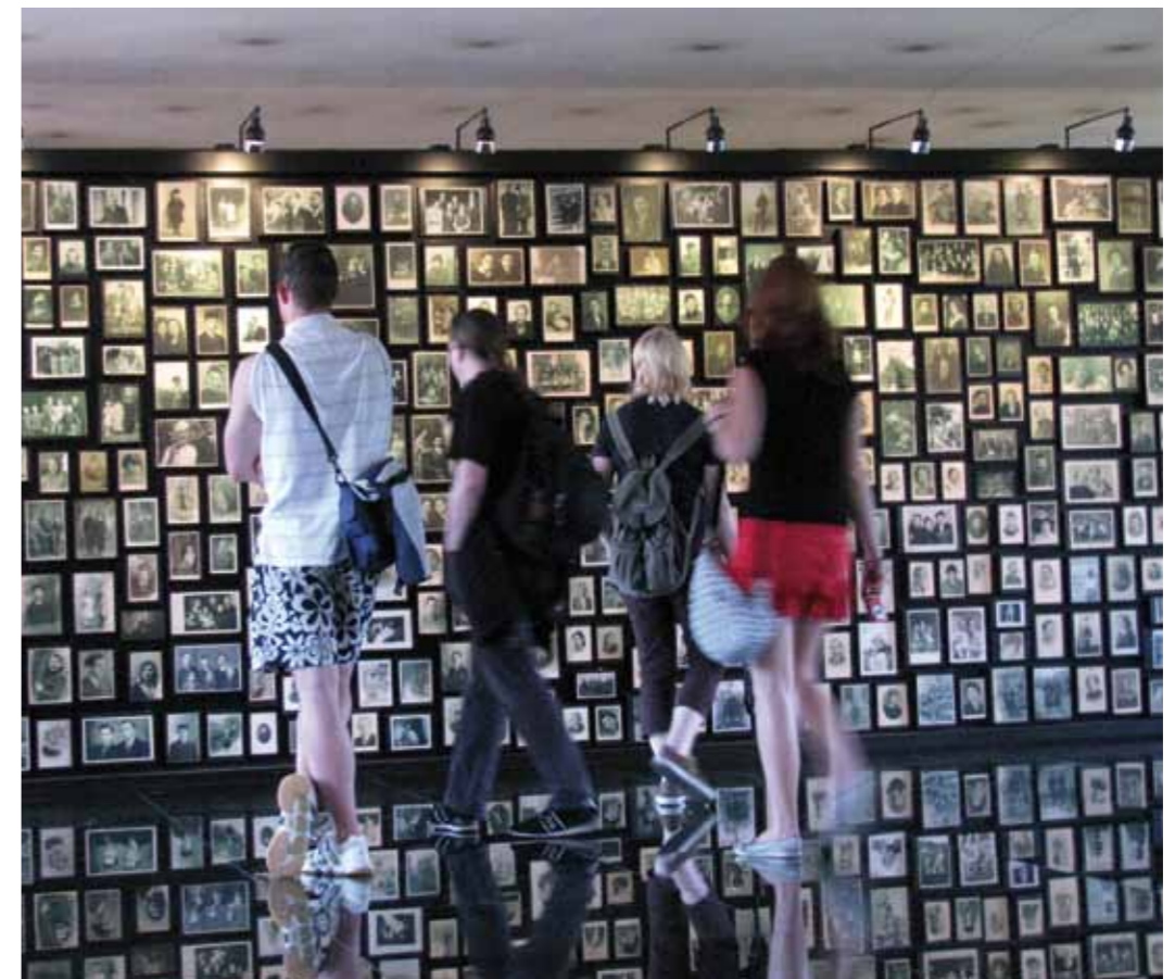
Führung in der Gedenkstätte Auschwitz-Birkenau