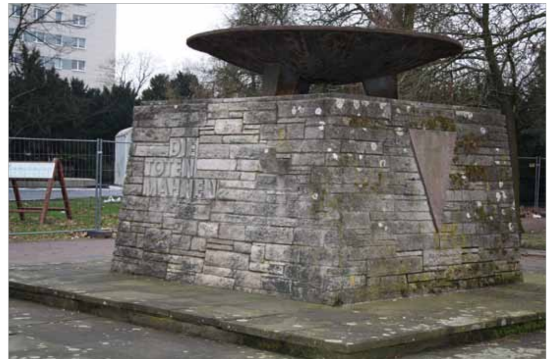
Mahnmal für die Opfer des Faschismus am Stadtpark in Dessau-Roßlau, 1960 eingerichtet