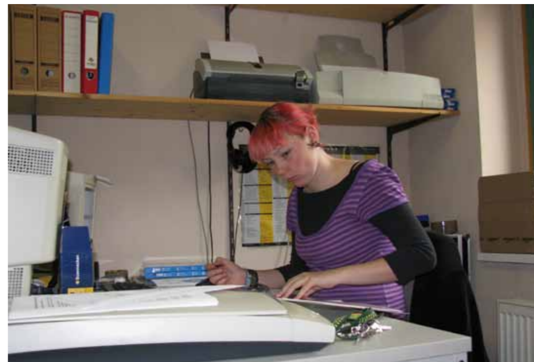
Recherche im Archiv