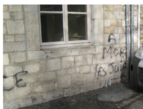
Marche-en-Famenne (b), 31-08-2014