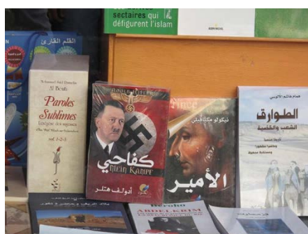
Ouvrage exposé dans une vitrine à Bruxelles (17-07-2014)

Les actes verbaux recensés en 2014 (17) voient, généralement, leurs auteurs appeler à la mort des juifs dans un sens large. D'autres sont directement la conséquence d'actes d'harcèlements où l'(es) auteur(s) rappelle(nt) ou évoque(nt) l'origine juive de la(des) victime(s) pour justifier des positions hostiles à son(leurs) égard(s) (courant dans des conflits de voisinage, signalement du 28-08-2014) ou simplement des insultes à l'encontre de personnes identifiées comme « juives » (insultes de fidèles, de passants à la sortie d'une synagogue). Est également considéré comme un acte antisémite idéologique de type verbal, des commentaires indignes prononcés par un homme politique au parlement fédéral (15-01-2014), une annonce « appelant les Juifs à sortir d'un train pour prendre une douche à Auschwitz » (31-01-2014), le rejet d'une dame d'un commerce à Anvers parce que « juive » (16-07-2014) ou encore le refus d'un médecin de soigner une personne juive de 90 ans (30-07-2014). Les propos négationnistes tenus par un professeur en classe (21-1-2014) et des propos antisémites scandés par des « supporters » de foot (20-04-2014) sont également retenus dans la présente catégorie. 95% des signalements idéologiques verbaux ont eu lieu dans l'espace public.