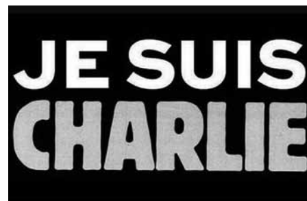
Obr. 2: Slogan „Je suis Charlie“ vznikl v reakci na útoky islamistických radikálů na redakci satirického časopisu Charlie Hebdo v Paříži v lednu 2015 a posléze se stal fenoménem sociálních sítí. Lidé prakticky ze všech zemí světa se přihlašovali k tomuto sloganu snažili ukázat svou sounáležitost s oběťmi útoků a jasně odmítnutí terorismu a násilí.

lostí se objevuje nový termín antisionismus, který lze charakterizovat jako opozici vůči židovskému nacionalismu. Zatímco kritika Izraele byla v západní Evropě druhé poloviny 20. století poměrně obvyklým jevem, antisemitismus byl vždy chápán jako společensky nepřijatelný fenomén. V případě Francie je nutné zmínit početnou muslimskou komunitu, která v současné době tvoří 5–10 % celkové populace (CIA World Factbook). Existence početné muslimské komunity se obvykle uvádí jako důležitý faktor, který do určité míry ovlivňuje vztah společnosti k místní židovské komunitě. Není samozřejmě možné generalizovat, ale obecně je možné říci, že většina muslimů nejenže neschvaluje řadu kroků izraelské zahraniční politiky, ale v arab-