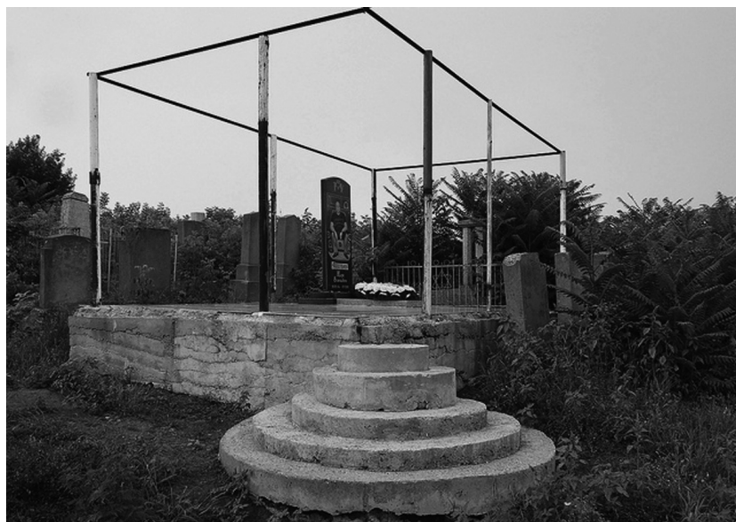
Ил. 2 Памятник на еврейском кладбище в г. Бельцы (Молдова). Фото Э. Иоффе. 2011 г.

Изображать самого покойного на надгробном памятнике до последнего времени было не принято. Традиционная символика включала в себя изображения животных, растительный узор и определенный набор символов. Звезда Давида стала использоваться для украшения памятников только с последней трети XIX в., но в начале XX столетия уже приобрела огромную популярность, что скорее всего связано с расцветом сионизма. Памятники начала XX в. отличаются скромностью, чего нельзя сказать, например, о памятниках постсоветского периода в Бессарабии. «Еврейские надгробия – это целая история жизни человека, который похоронен, так как вся символика отражает его социальный статус, его профессию, его добродетели и даже его пороки, – рассказывает представитель еврейской общины в Бельцах. – Раз машина – значит, скорее всего погиб в автомобильной катастрофе» 11 . Современные памятники на еврейском кладбище г. Бельцы вообще пестрят предметами роскоши – изображениями машин, кожаных диванов и прочих символов богатства