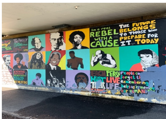
Muralmålning i Biskopsgården, Göteborg, 16 mars 2021. Leila Khaled finns avbildad längst till höger i mitten.

Det relativa lugn, med några undantag, som utmärkt IP-konflikten sedan det senaste kriget i Gaza 2014 har också bidragit till avmattningen i den IP-centriska världsbilden som vi ser i Sverige och andra delar av världen idag. Avmattningen är påtaglig och syns tydligt i den svenska politiska debatten, i mediebevakningen kring konflikten, i antalet seminarium om konflikten som anordnas på svenska universitet, i minskningen av affischering, klistermärken och klotter i Sverige angående IP-konflikten och så vidare. Det såklart svårt att på ett vetenskapligt sätt mäta graden av affischering, klistermärken och klotter över tid i Sverige som är kopplad till IP-konflikten, men det är värt att nämna att författaren till denna studie besökte Sveriges tre största städer Stockholm, Göteborg och Malmö, inklusive de mest kända utanförskapsområdena: Järvafältet (Tensta, Rinkeby och Husby) i Stockholm, Bergsjön, Angered och Biskopsgården i Göteborg, samt Rosengård och Seved i Malmö i samband med studien. På Järvafältet kunde jag inte hitta någon typ av affischering, klistermärken eller klotter kopplad till konflikten. Jag hittade en hel del pro-palestinska/anti-israeliska klistermärken i Bergsjön och Biskopsgården, samt en stor muralmålning i Biskopsgården där den kända palestinska flygkaperskan Leila Khaled finns avbildad.