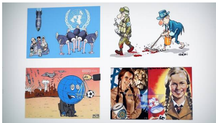
De fyra teckningarna som den utpekade läkaren delat på Facebook. 124

Ett annat exempel där antisemitiska tankestrukturer överförs på Israel är Uppdrag gransknings program ”Karolinska och judehatet” där delar av kontroversen handlade om fyra bilder på Facebook som den utpekade läkaren delat. En av dessa jämför Israel med nazismen precis som Kaplan gjorde. En annan bild visar att världssamfundet är hypnotiserad av en oklar aktör till att titta bort när Israel bombar Gaza, en åtminstone implicit hänvisning till Israel som dominerande och kontrollerande. 123